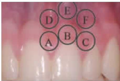
图1 中切牙区域牙龈测色部位示意图

1.2 测色部位 共设6个测色部位,分别为:中切牙近中龈乳头、中切牙游离龈、中切牙远中龈乳头、中切牙中线附着龈、中切牙根部附着龈、中切牙远中根间附着龈(图1)。