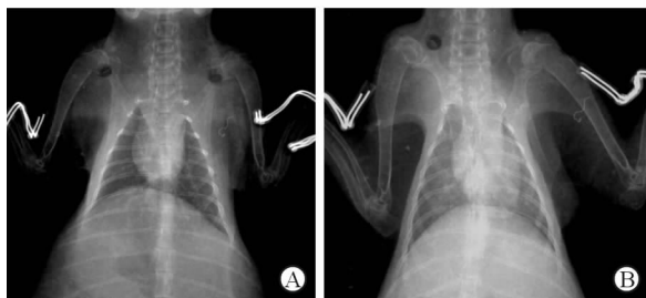
图2 实验组兔术前(A)及术后8周(B)X线胸片

2.5 X线胸片比较 X线胸片见大部分兔心影稍偏左,与人类相似,小部分兔心影稍偏右或居中。术前实验组和对照组兔心胸比值差异无统计学意义( 0.33 \pm 0.15 vs 0.34 \pm 0.14 )。实验组术后8周兔心胸比值高于术前( 0.55 \pm 0.16 vs 0.33 \pm 0.15 , t = 2.819 , P < 0.05 ; 图2),对照组心胸比值术前、术后无明显变化( 0.34 \pm 0.14 vs 0.33 \pm 0.12 )。