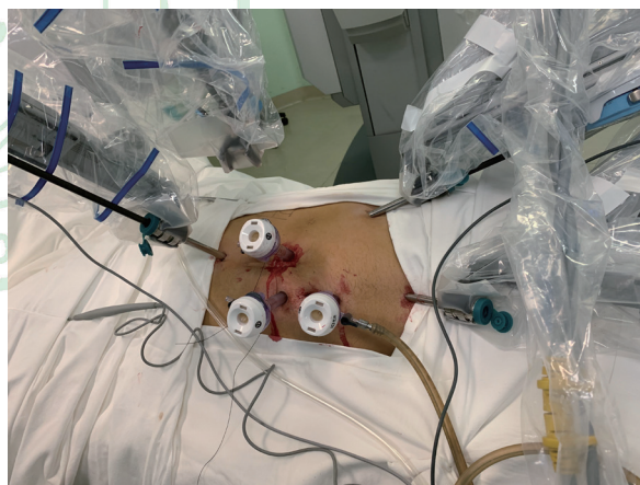
图 1 机器人辅助腹腔镜肾盂成形术套管分布及体位 Fig 1 Trocar placement and position for robot-assisted laparoscopic pyeloplasty

1.2 手术方法 27 例患者均使用达芬奇手术机器人系统 (da Vinci Si) 行经腹腔入路挽救性机器人辅助腹腔镜肾盂成形术。患者全身麻醉后留置导尿管并夹闭以充盈膀胱,取健侧卧位,常规消毒铺单,建立气腹。于脐头侧 2 横指处纵行切开皮肤,置入 12 mm 机器人套管作为镜头通道,置入镜头。直视下放置 3 个 8 mm 机器人套管作为机械臂通道。第 1 机械臂通道位于右侧锁骨中线肋缘下方 2 指偏内侧镜头套管上方 8 cm 处,并与其处于同一垂线;第 2 机械臂通道位于右侧锁骨中线偏外侧镜头套管外下方 8 cm 处,第 1、2 机械臂通道形成以镜头通道为顶点、顶角为 120° 的等腰三角形;第 3 机械臂通道位于第 2 机械臂通道内下方 8 cm 处第 1 机械臂通道与镜头通道的延长线上。于脐正中稍下方放置 12 mm 套管作为辅助通道 (图 1)。床旁机械臂系统自患者头侧、沿躯干长轴方向垂直进入,与各套管对接,在镜头直视下第 1 机械臂置入单极弯剪,第 2 机械臂置入 Maryland 双极抓钳,第 3 机械臂置入专业抓钳。