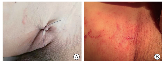
图1 无导线心脏起搏器植入患者股静脉大口径鞘管介入治疗手术切口术后缝合 鞘管外径为27F。A:“8”字缝合;B:皮下“Z”字缝合,皮肤表面用医用生物胶粘合。

1.2 缝合方法 房颤冷冻消融球囊的鞘管外径为16F,无导线心脏起搏器输送鞘管外径为27F。“8”字缝合组在完成介入手术撤除鞘管之前,采用3-0可吸收缝线进行“8”字缝合(图1A),缝合方法与文献[5]报道一致。