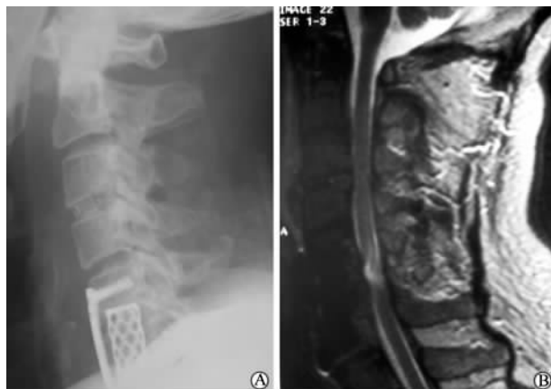
图2 翻修术后3个月颈椎侧位片(A)和MRI检查结果(B) A:C 3/4 cage固定,C 5-7 钛网、钢板重建;B:C 5-7 钛网、钢板影,脊髓形态恢复基本满意

入院后完善相关检查,于2006年8月11日全麻下行颈前路翻修、减压植骨内固定术。术中切除C 3/4 椎间盘、cage固定,切开C 5/6 人工椎间盘表面聚氨酯外套,骨凿于人工椎间盘钛合金外壳与椎体接触面开槽,以咬骨钳钳夹外壳牵拉,但无法取出人工椎间盘。遂由下而上逐步切除C 6 椎体,至C 6 上终板边缘,切除残余薄层骨质时,人工椎间盘外壳随之松动取出。摘除聚氨酯核心,于C 5 终板边缘开槽,撬拨取下人工椎间盘另一侧外壳,进一步减压C 5/6 椎间隙,见C 5 后缘、C 5/6 间隙局部硬膜囊表面瘢痕形成,与椎体后缘粘连,无法切除。扩大减压范围,漂浮局部瘢痕结构,探查硬膜囊压力低。钛网、钢板重建C 5-7 序列。翻修术后患者自觉四肢轻松感。术后7d患者伸屈腕肌力Ⅲ级,双侧食指、中指屈指肌力Ⅲ级,双足伸趾、屈趾肌力Ⅲ级;可完成单次伸屈膝动作,肌力Ⅲ级。颈托保护1个月。翻修术后3个月颈椎侧位片可见植骨融合(图2A);MRI检查见C 5-7 钛网、钢板影,脊髓形态恢复基本满意(图2B);十指伸屈功能恢复,肌力Ⅳ级,伸屈趾肌力Ⅳ级,可重复完成伸屈膝动作,肌力Ⅲ级。