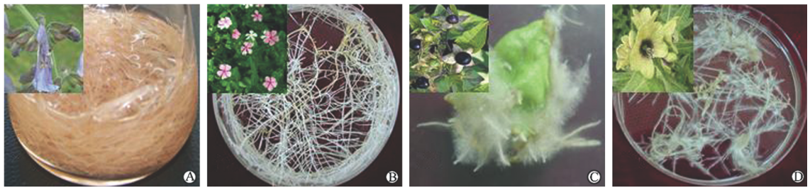
图2 本实验室建立的几种药用植物发根培养体系

水平上进行遗传操作,研究发根的转化和植株再生提供了很大的潜力。本实验室已陆续成功建立了多种药用植物的发根培养体系(图2),为后续开展代谢调控研究提供了转化系统。